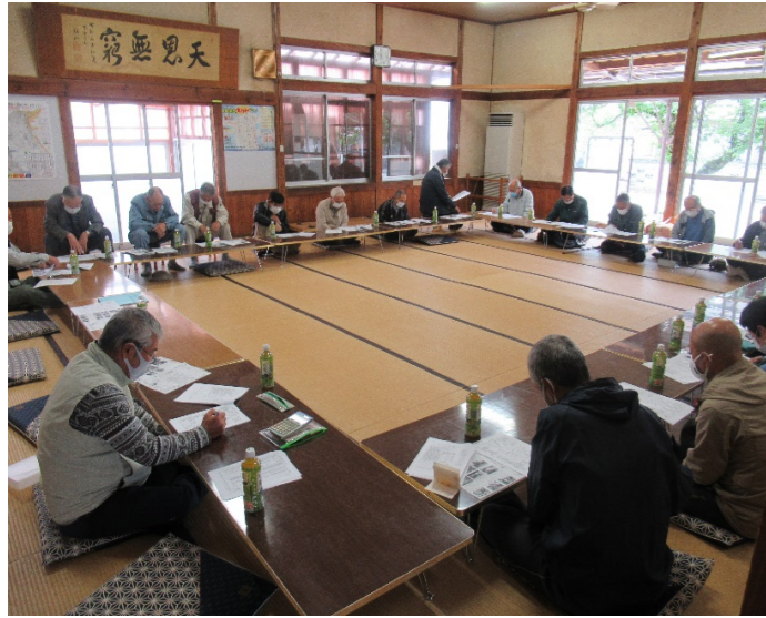
令和3年度竹内マツ植樹隊定期総会 (5月1日)

●竹内マツ植樹隊の活動につきましては、日頃より格別のご理解ご支援を賜り厚く御礼申し上げます。会員の皆様、ご寄付頂いた個人・団体・企業の皆様有難うございます。 ●当会は令和2年度(第8期整備事業)で当初の目的は達成し、今年より第2ステージに入りました。この整備した緑地を活用し遊歩道や憩いの広場や桜並木の整備を行う予定にしております。予定しておりました事業は①マツ・桜の苗木の植樹、②凹凸地盤の均し、③対象緑地の除草、④乗用草刈り機購入、⑤備品倉庫の設置、⑥憩いの広場のイス・テーブルの設置、⑦遊歩道の整備を予定しています。未着手事業は、④、⑤、⑥あり、年度内に備品倉庫の設置に取り組む予定です。 ●R3年11月マツ現在、個人68件85,000円、大口2件30,000円、企業1件2,000,000円の寄付金をお預かりしました。合計2,115,000円で、活動費と一部基金に充てさせて頂いています。期間(R3.4~R3.11)