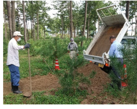
9月地盤均し(土砂投入)